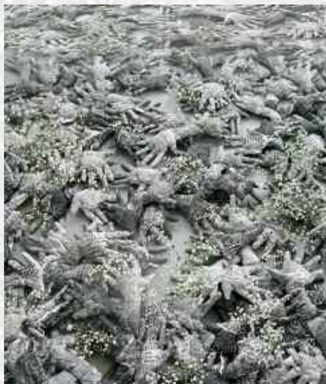
Mains , 135 x 135 cm, 1997