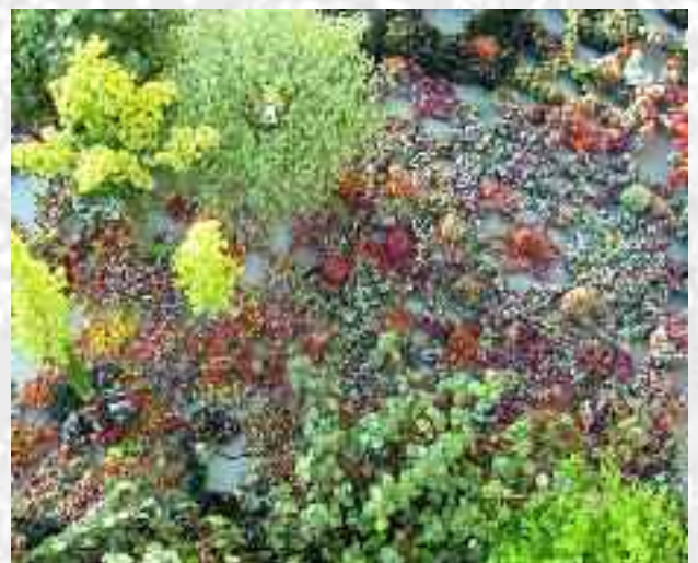
Vue du ciel , 160 cm de diamètre environ, 2011, détail

Observer avec humilité et transcrire pour s'imprégner, extraire la sève, aspirer, être en osmose, capturer l'essence du modèle... Dessiner pour mieux voir et comprendre le sujet et pour, entre autres, découvrir des procédés techniques pertinents. Étoffer sa culture, cultiver sa mémoire notamment visuelle et tactile... développer sa sensibilité, c'est là une source d'informations inépuisables.