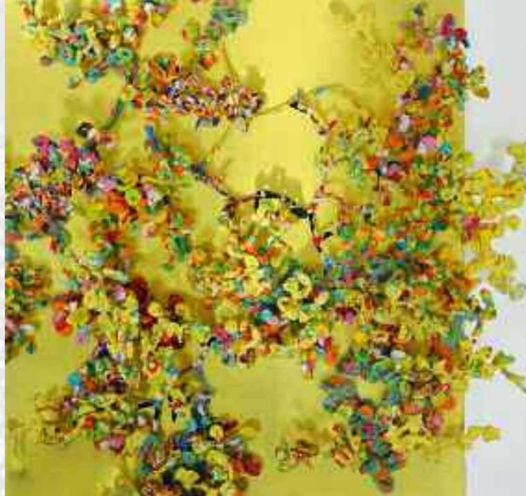
Genets , 50 x 65 cm, 2013