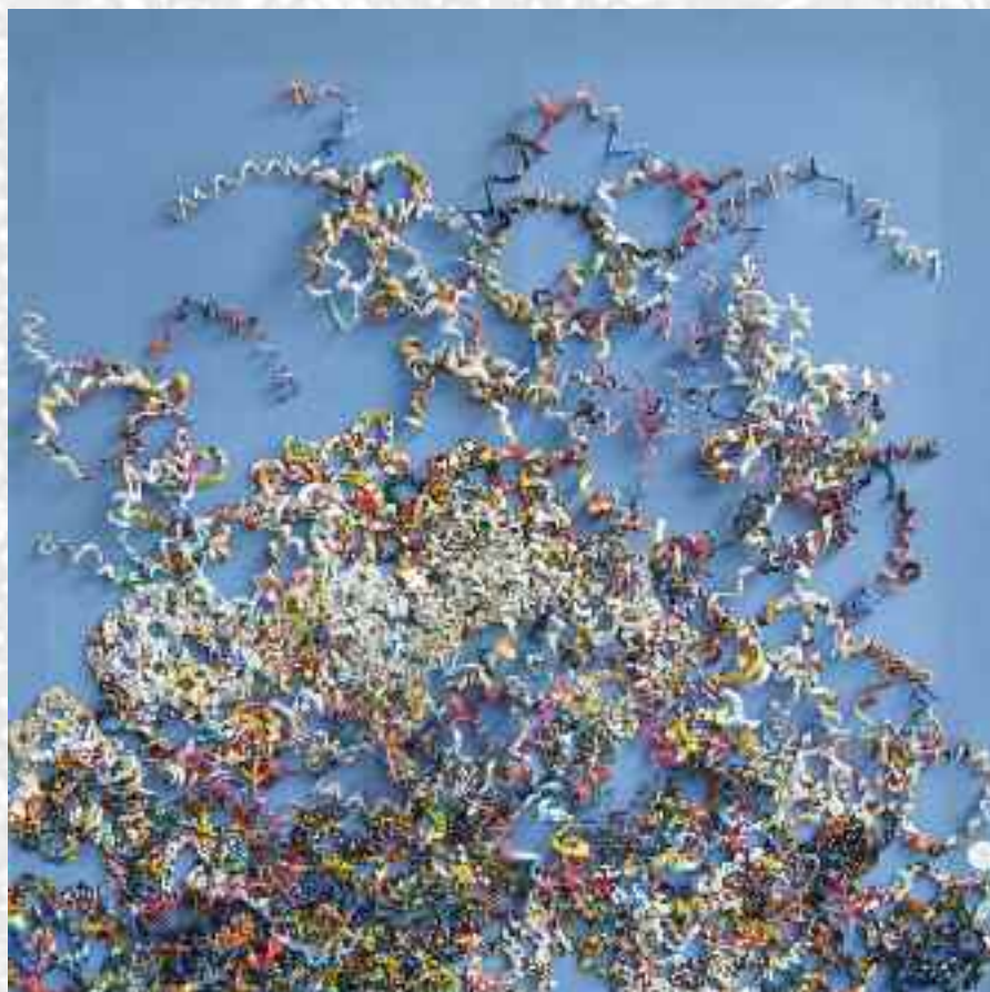
Écriture végétale , 100 x 100 cm, 2013

Depuis des années, elle approfondit des recherches d'expression plastique en 2D et 3D avec des techniques et des matériaux divers (textiles et parfois inox, briques, galets...) pour des applications et des objectifs multiples et variés sur des thèmes le plus souvent inspirés de la nature.