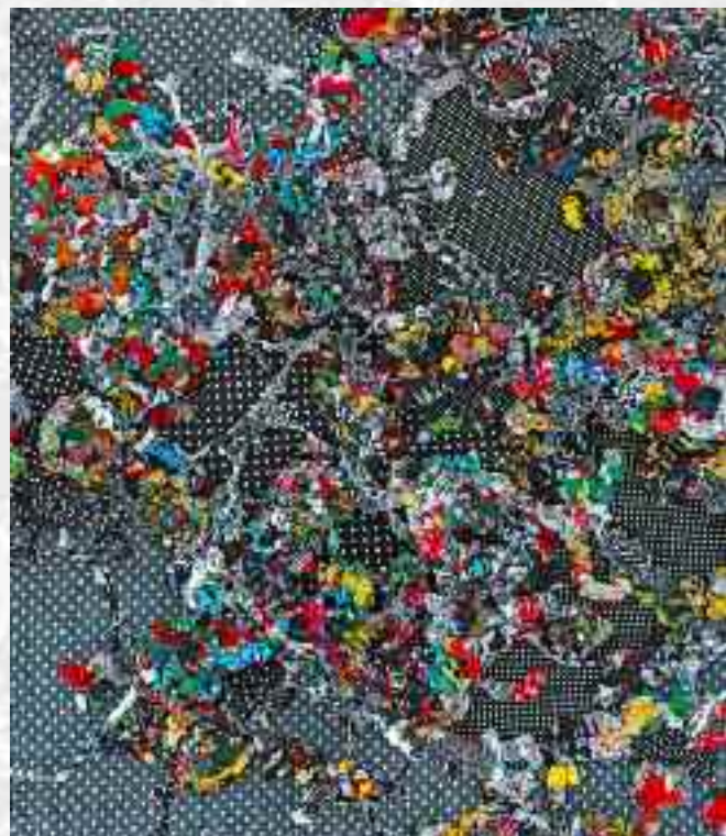
Îles en fête , 100 x 100 cm, 2012

Pour en savoir plus : http://www.francoise-tellier-loumagne.com/