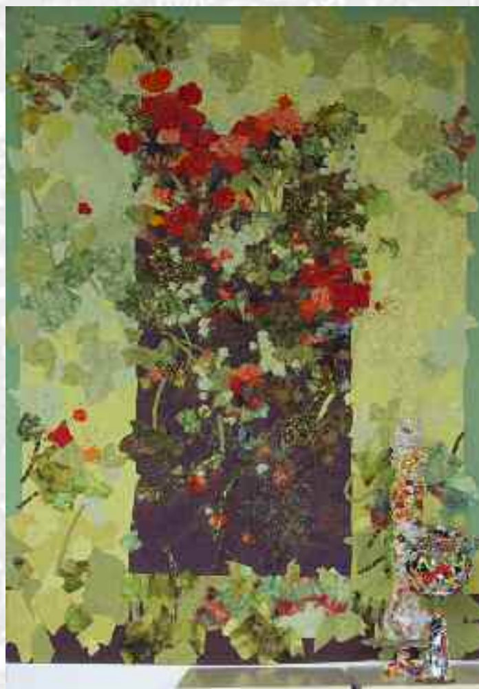
Compost , 165 X 110 cm, 2004