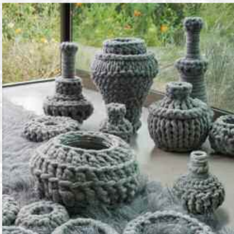
Amphores , de 7 à 54 cm de haut sur 10 à 22 cm de large, 2011

Commissaire des expositions de l' Aiguille en Fête