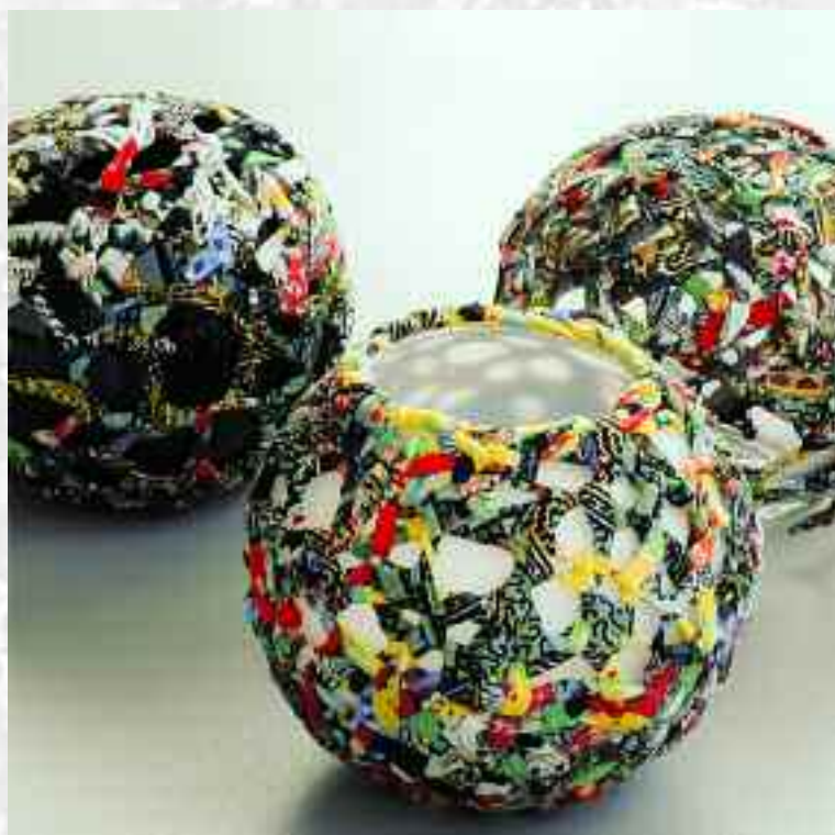
Urnes , 15 x 17 cm, 2012

Elle enseigne la création textile : diplôme des Métiers d'Arts, option Textile, BTS Mode et Environnement, DSAA Textile, licence professionnelle, formation continue, promotion sociale, conférences, workshop,... : à Paris (l'ESAA Duperré et à l'ENSAAMA Olivier de Serres), à Roubaix (l'ESAAT), etc.