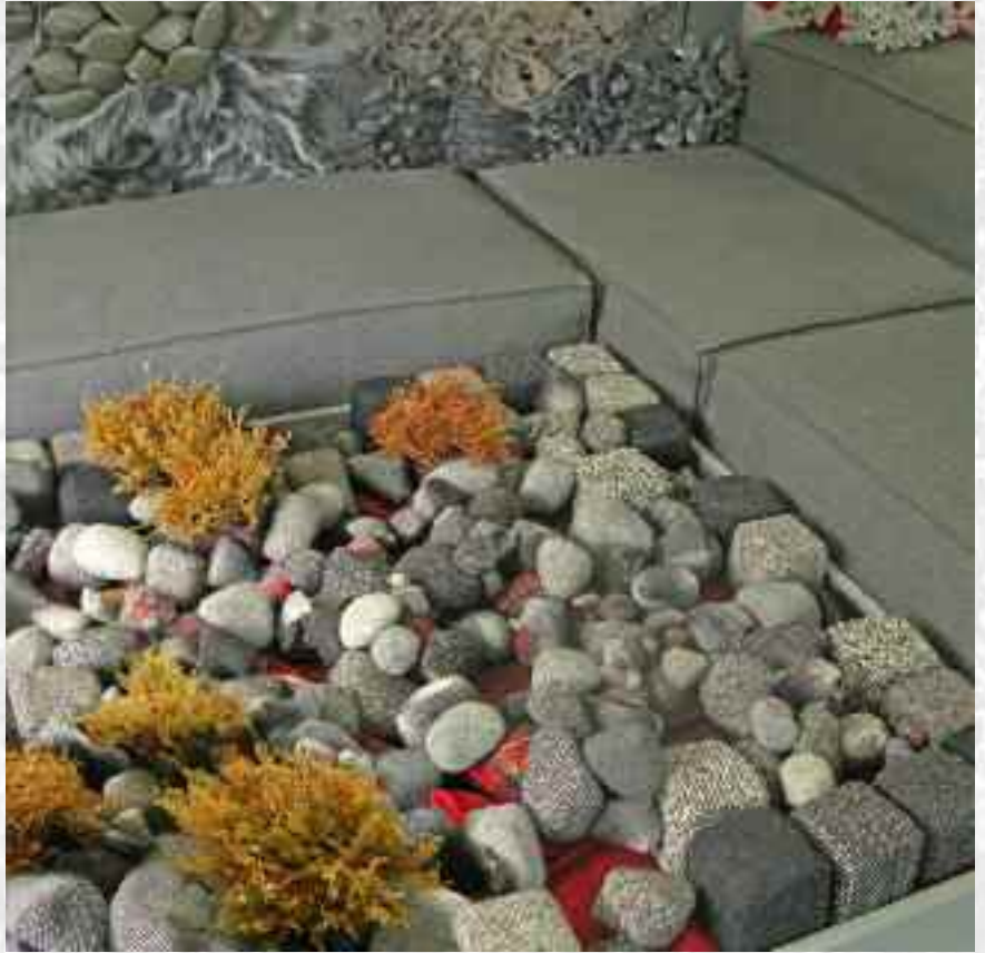
Rio aragonais , 125 x 125 cm, 2010

De toutes ses expériences, de tous ses allers et retours entre la pratique et l'enseignement, entre la recherche et la mise en œuvre, de toutes ces passerelles qu'elle ne cesse de lancer entre les techniques ancestrales de maille ou de broderie et les applications surprenantes qu'offrent les nouvelles technologies, du crayon au pixel, de la technique de sublimation à la contemplation du sublime comme source d'inspiration, de l'aplat à la 3D, du silence de l'atelier au